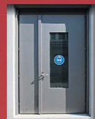
4 Heizzentrale Baden Nord