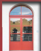
2 Kraftwerk Kappelerhof