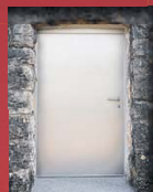
5 Reservoir Belvédère