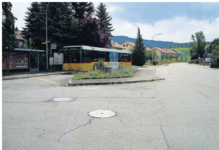
Zwei Meter unter der blauen Markierung fliesst der Maasbach heute.