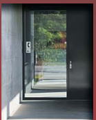
3 Werkhof Roggebohle